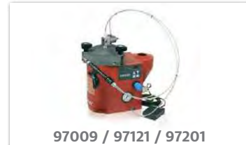
97009 / 97121 / 97201

Das Halbautomatische LOCTITE Dosiersystem ist eine integrierte Konstruktion von Steuergerät und Tank für die Dosierung von vielen LOCTITE Schraubensicherungen mit Hilfe von Ventilen. Mit digitaler Zeitsteuerung, Leermeldung und Fertigmeldung. Quetschdosierventil für die Dosierung im Handbetrieb oder als stationäres System. Die Tanks sind groß genug für die Aufnahme von 1 1/2 kg-Flaschen und sind mit einer Füllstandanzeige für Leermeldung ausgerüstet.