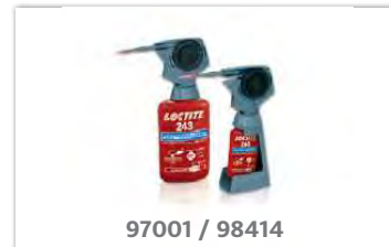
97001 / 98414

Diese Geräte können einfach auf jede 50 ml- oder 250 ml-Flasche aufgeschraubt werden. Sie machen das anaerobe LOCTITE Produktgebilde zu einem tragbaren Handdosiergerät. Sie ermöglichen das Dosieren in jeder Lage, in Tropfengrößen von 0,01 bis 0,04 ml - genau, ohne Tropfen oder Produktvergeudung (für Produkte mit einer Viskosität bis 2.500 mPa·s).