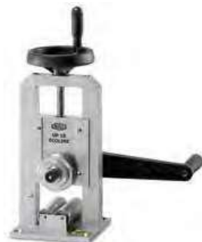
UP 10 Ecoline