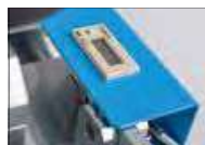
508.7001 Zähler für UP 15