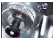
504.003 Zusätzlicher Typenhalter für die UP 10 Ecoline. Einfacher Wechsel zwischen unterschiedlichen Prägungen. 25 Typen.