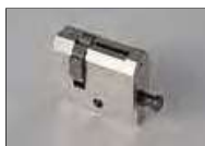
508.1003.3( 10 Typen in einer Reihe) 508.1001.3 (17 Typen verteilt auf 2 Reihen) UP 15