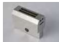
508.1002.3 (26 Typen, 13 pro Reihe)