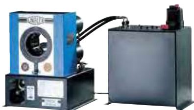
HM 200 Ecoline