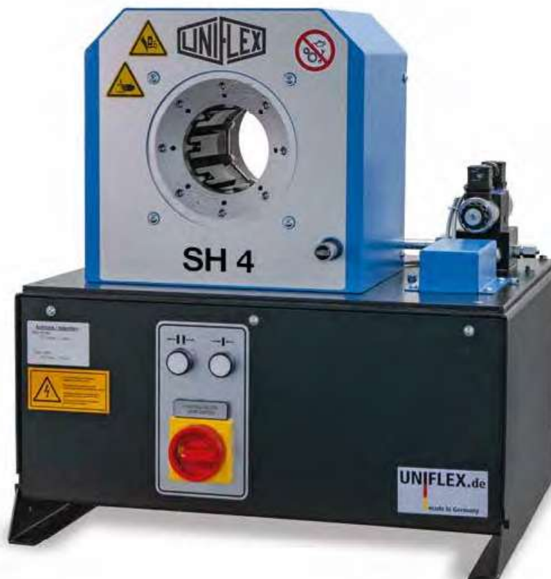
SH 4 Ecoline

Durch die schmale und innovative Bauweise, die hohe Anwenderfreundlichkeit, Vielseitigkeit und lange Lebensdauer setzt die SH 4-Serie Maßstäbe für Qualität und Wirtschaftlichkeit. Ihre trotz großer Presskraft sehr kompakte Bauweise und ein Gewicht von nur 110 kg erlauben ergonomisches Arbeiten auch auf mobilen Einsätzen. Die langen Grundbacken ermöglichen das Verpressen bis 1½ Zoll 4 SP, die bewährte schmierungsfreie Gleitlagertechnologie senkt Wartungskosten und steigert die Produktionsqualität.