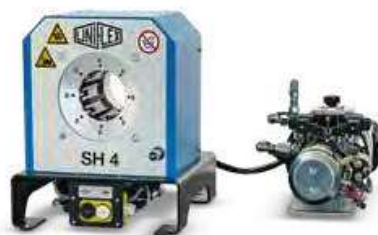
SH 4 Mobileline