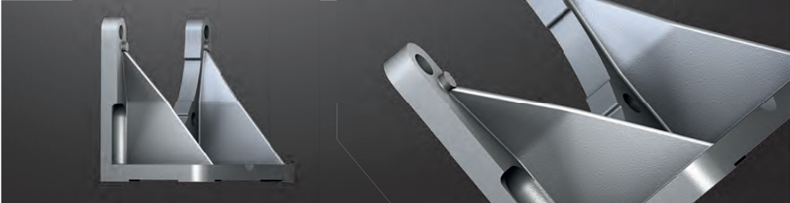
Fußflansch PTFL *