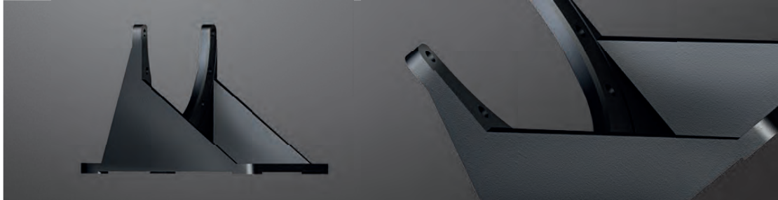
Fußflansch PTFS *